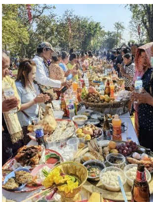
Figure 6 โครงการแซนตาปราสาทบ้านพลวง

๔.๒ ประชาชนที่เข้าร่วมโครงการได้มีส่วนร่วมในการสืบสานประเพณีวัฒนธรรมท้องถิ่น เยาวชนรุ่นหลังได้รับความรู้จากการเข้าร่วมประเพณีดังกล่าว ผู้เข้าร่วมโครงการมีความพึงพอใจต่องานโครงการประเพณีบวงสรวงแซนตาปราสาทบ้านพลวง โดยภาพรวมของการจัดกิจกรรมพบว่าผู้เข้าร่วมโครงการมีความพึงพอใจอยู่ในระดับมากที่สุด คิดเป็นร้อยละ ๘๙.๑๔ โดยหากแยกเป็นรายข้อจะพบว่าผู้เข้าร่วมโครงการมีความพึงพอใจในระดับมากที่สุดในทุกๆด้าน ส่วนด้านที่มีคะแนนความพึงพอใจมากที่สุดคือ กำหนดการ และระยะเวลาในการจัดกิจกรรมในครั้งนี้ มีความเหมาะสม คิดเป็นร้อยละ ๙๒.๐๐