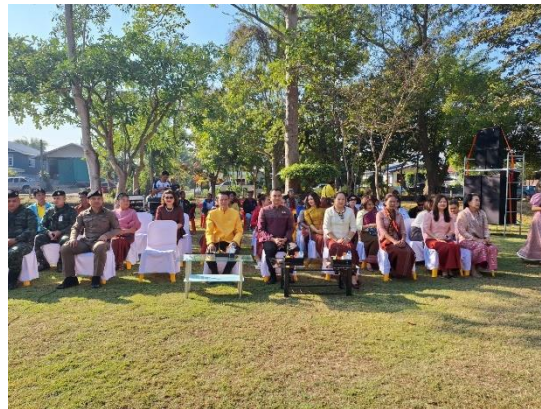
Figure 7 โครงการแซนตาปราสาทบ้านพลวง