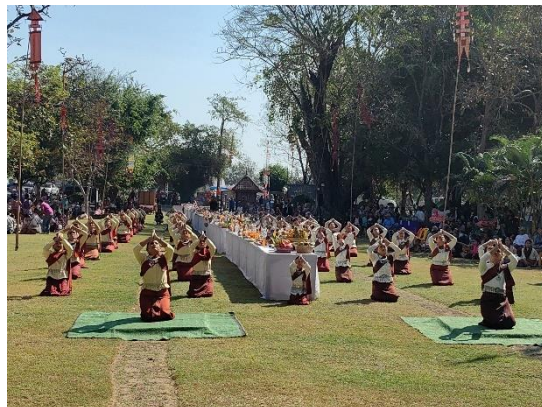
Figure 11 รำบวงสรวงปราสาท โดยนางรำ ตำบลบ้านพลวง