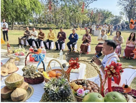
Figure 3 พิธีเซ่นตาปราสาทบ้านพลวง