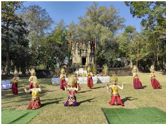
Figure 8 การแสดงรำอัปสรวา