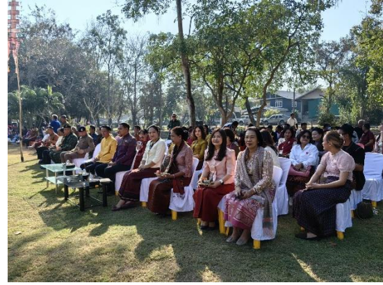
Figure 4 โครงการเซ่นตาปราสาทบ้านพลวง

ปราสาท เวลาที่ชาวบ้านมารวมกันเริ่มตั้งแต่เวลา ๐๖.๐๐ น. เป็นต้นไป พอทำพิธีเซ่นตาปราสาทเสร็จแล้ว ก็ จะรับประทานอาหารร่วมกัน