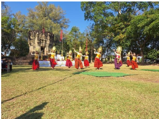
Figure 10 รำอั้งลิสา บวงสรวงปราสาทบ้านพลวง

บวงสรวงแซนตาปราสาทบ้านพลวง โดยภาพรวมของการจัดกิจกรรมพบว่าผู้เข้าร่วมโครงการมีความพึงพอใจอยู่ในระดับมากที่สุด คิดเป็นร้อยละ ๘๙.๑๔