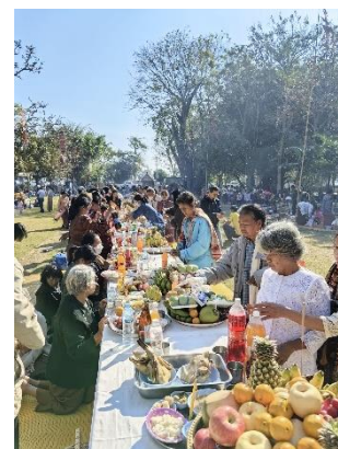
Figure 9 โครงการแซนตาปราสาทบ้านพลวง

มีความพึงพอใจต่อการจัดกิจกรรมอยู่ในระดับมากที่สุด คิดเป็นร้อยละ ๘๙.๑๔