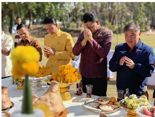
Figure 1 นายอำเภอปราสาท เป็นประธานในพิธีแซนตาปราสาทบ้านพลวง ประจำปี 2568