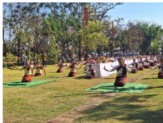
Figure 5 โครงการแซนตาปราสาทบ้านพลวง