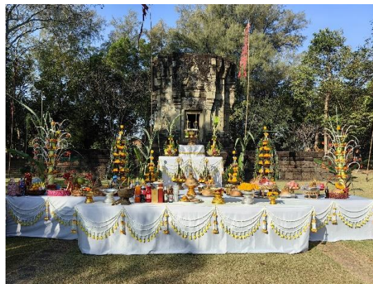
Figure 2 ภาพแสดงเครื่องเซ่นตาปราสาท ของ องค์การบริหารส่วนตำบลบ้านพลวง