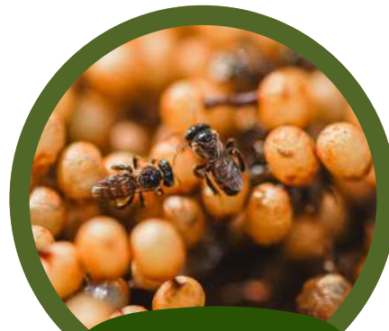
ผึ้งชันโรง